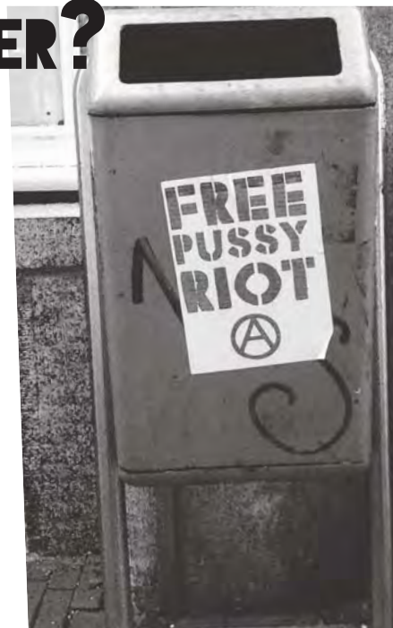
Posters voor pussy riot!

Hopelijk zullen er het komende jaar weer volop radicale, sociale, politieke en gezellige initiatieven georganiseerd worden waarmee we elkaar inspireren om in beweging te komen en te blijven. Zodat we ons samen kunnen verweren